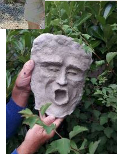
Vorentwürfe Bronzeplastiken auf Metallstelen Werner Bärmann